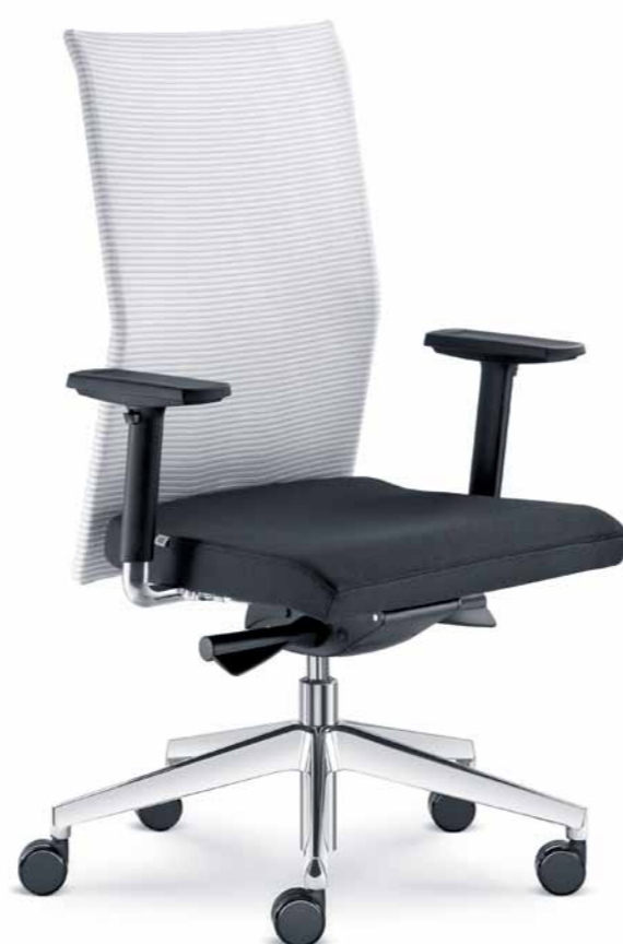
405-AT ■ + BR-209-N6