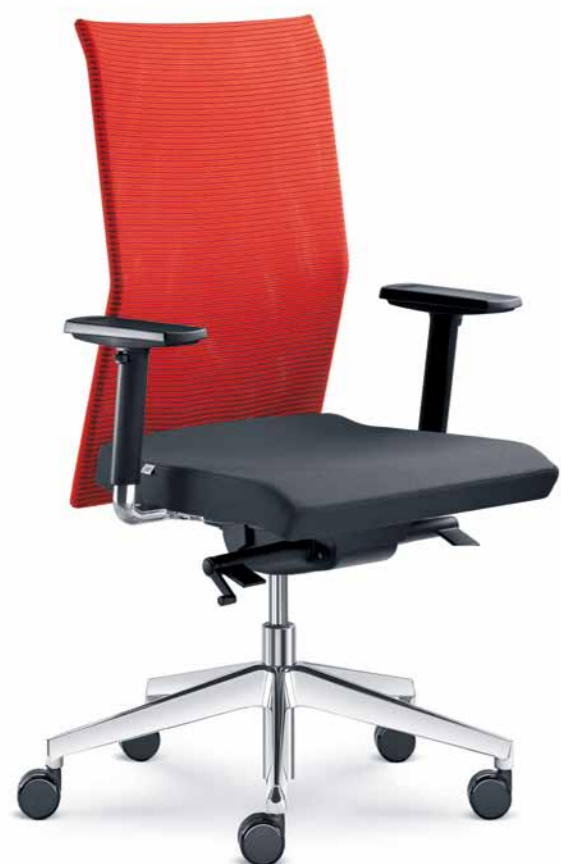
405-SYS ■ + BR-209-N6