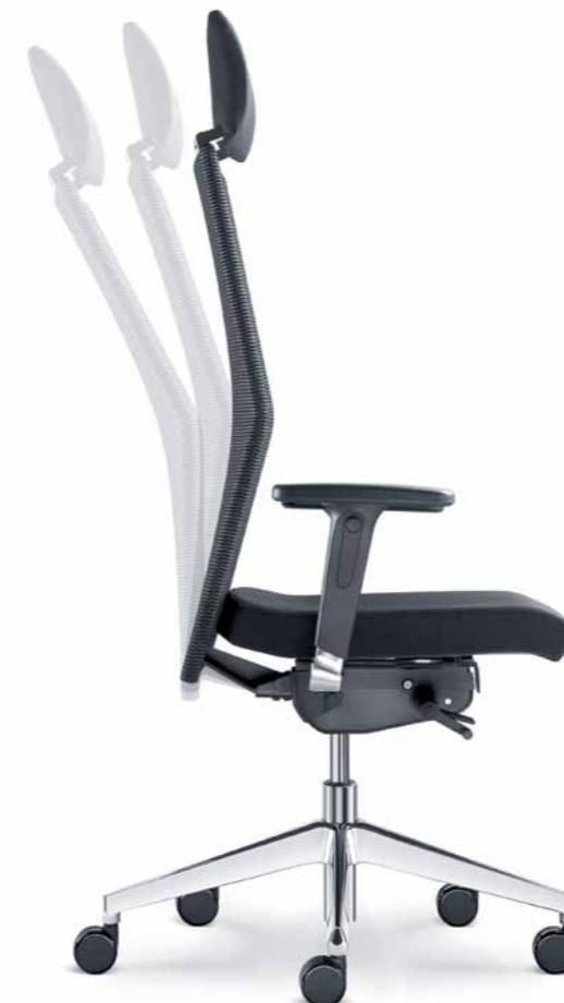
425-SYS ■ + BR-550-N6

Backrest angle setting and its synchronous motion with the chair seat, height-adjustable seat and optional adjustable functions such the seat depth or angle setting independent of the mechanism movements are provided as a matter of course.