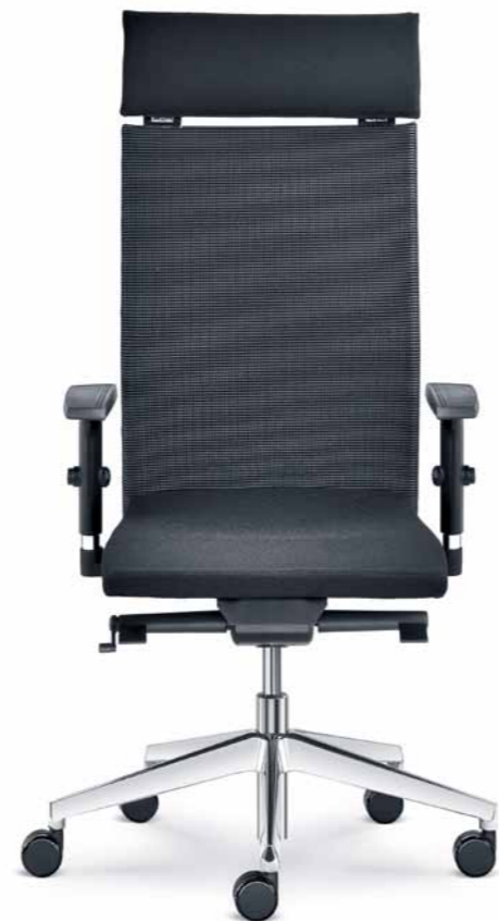
425-SYS ■ + BR-470-N4