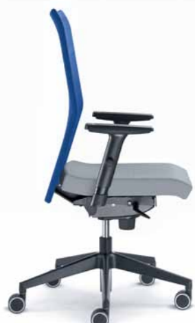
410-SY ■ + BR-470-N1