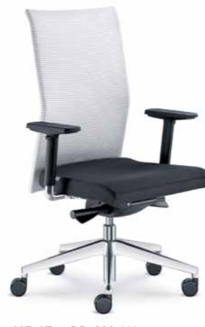
405-AT ■ + BR-209-N6