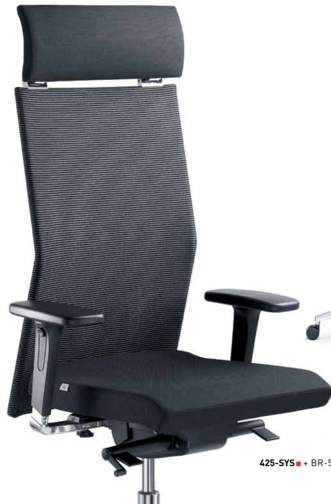
425-SYS ■ + BR-550-N6