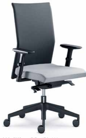
410-SYS ■ + BR-470-N1