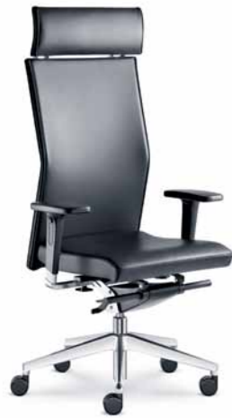
420-TI ■ + BR-550-N6