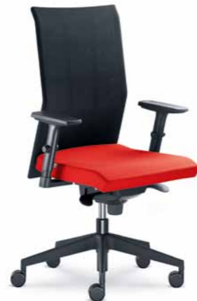
400-SY ■ + BR-470-N1