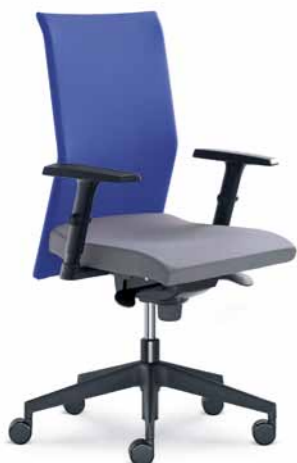
410-SY ■ + BR-470-N1