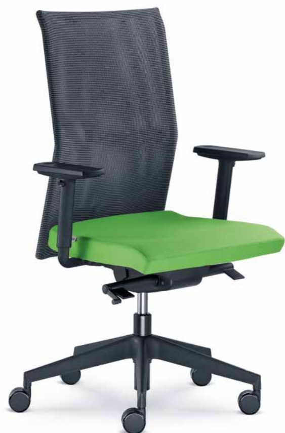
405-SYS ■ + BR-209