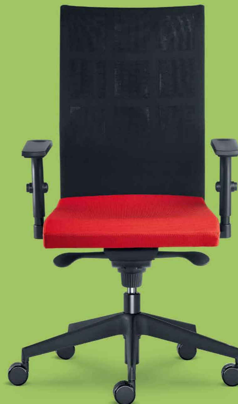
400-SY ■ + BR-470-N1

Web conference chairs are very comfortable for short and long-term sitting thanks to the upholstery and a "spring" steel frame.