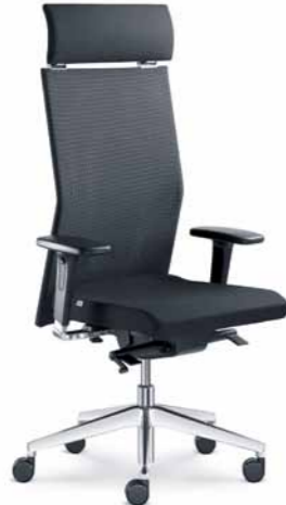
425-TI ■ + BR-550-N6