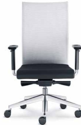
405-AT ■ + BR-209-N6