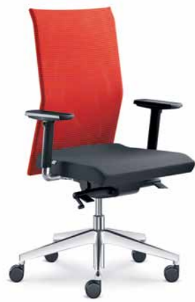
405-SYS ■ + BR-209-N6