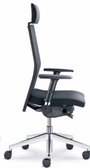
425-SYS ■ + BR-470-N4