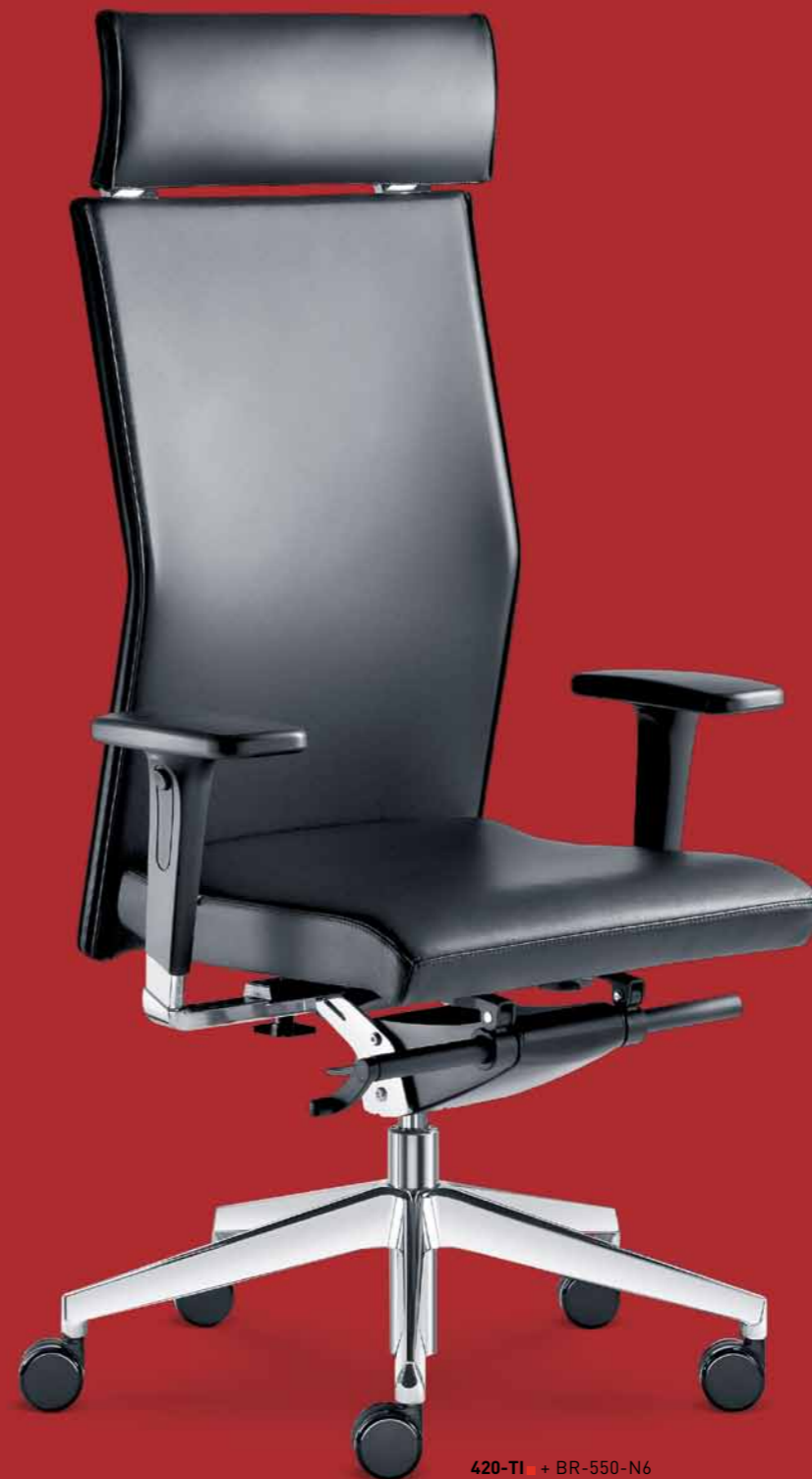
420-TI ■ + BR-550-N6