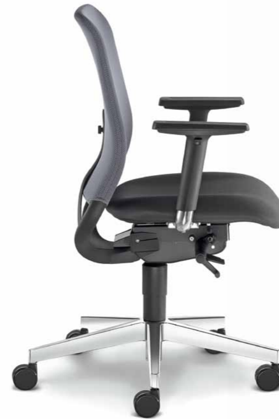
260-SYS ■ + BR-209-N6