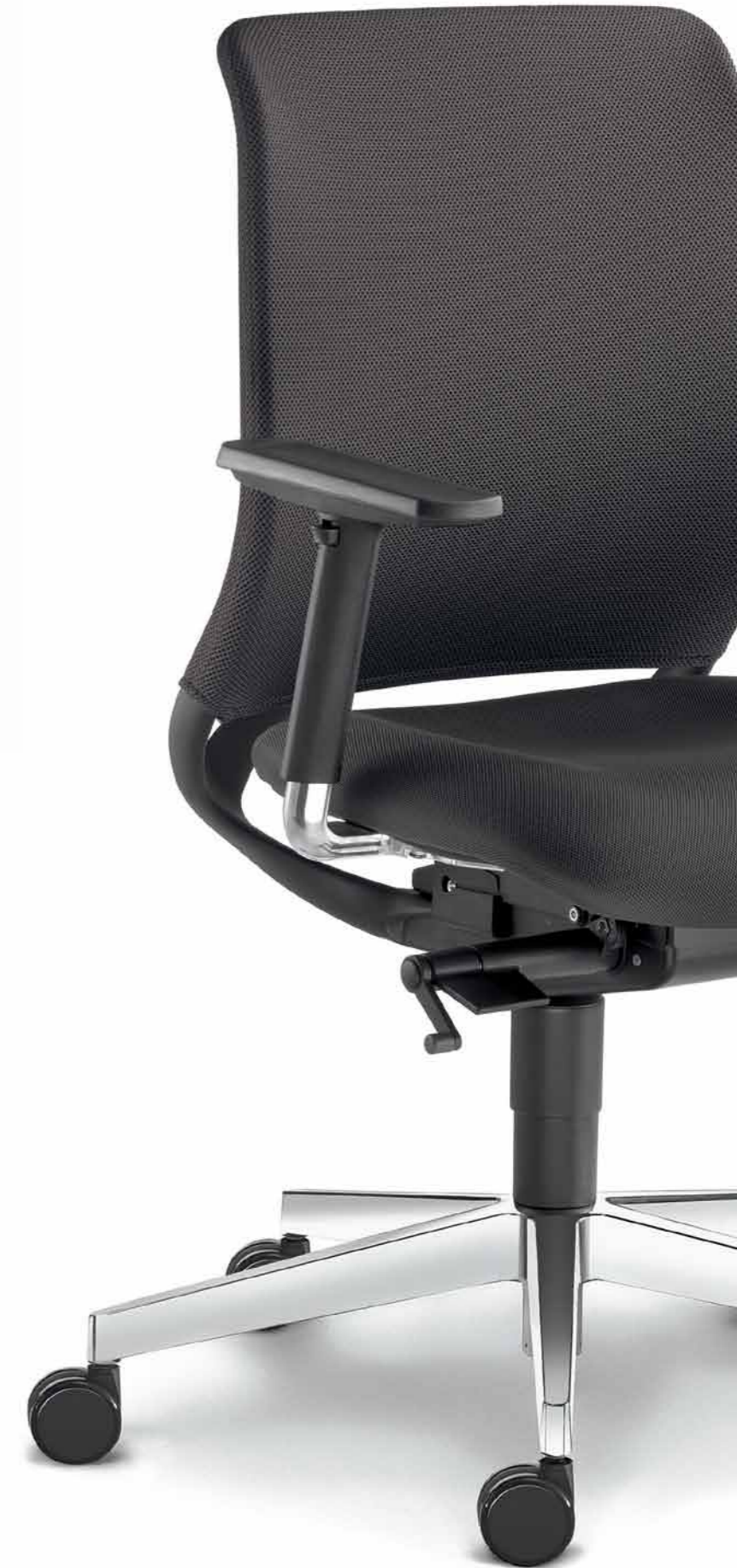
260-SYS ■ + BR-209-N6